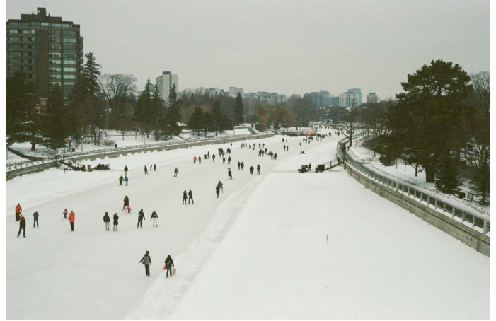
Colline du Parlement et le célèbre canal Rideau à Ottawa

Choisis parmi 21 écoles situées à Ottawa et dans les petites villes environnantes telles que Nepean et Orleans . Ottawa, la capitale du Canada, est un lieu d'échanges important mais qui a l'atmosphère d'une petite ville où il est possible de profiter de la vie dans une grande ville tout en explorant ce que le Canada a à offrir en termes de grands espaces.